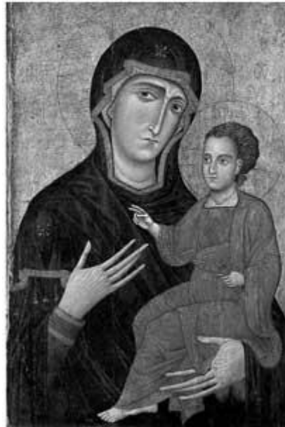
Madona e Filho, Berlinghiero, século XII.