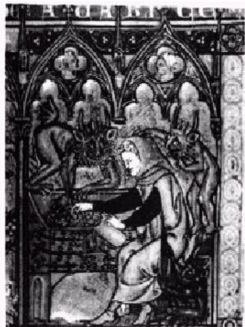
A Avareza. Iluminura de um manuscrito do século XV.