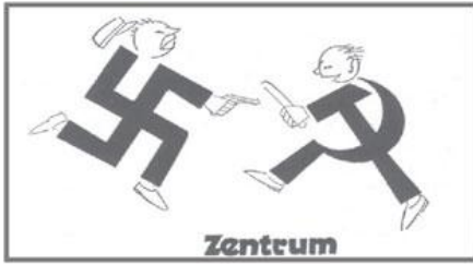
LAMBIN, Jean-Michel. Histoire. Paris: Hachette, 2002. p. 207. Adaptado

O cartaz apresenta símbolos de dois grupos políticos que, no poder,