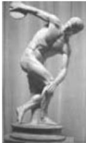
Egito antigo: clássica. Míron: Discóbolo. cerca de 450 a.C. Sentado. século XXVI a.C.