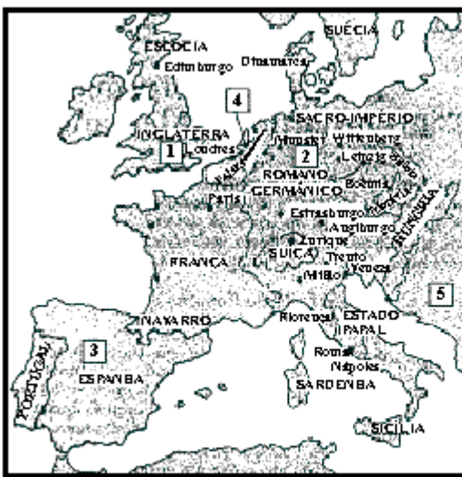
Mapa do Sacro Império Romano-Germânico e das divisões políticas da Europa no século XVI.