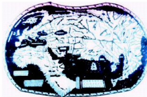
Mapa mundi de Henricus Martellus, 1498