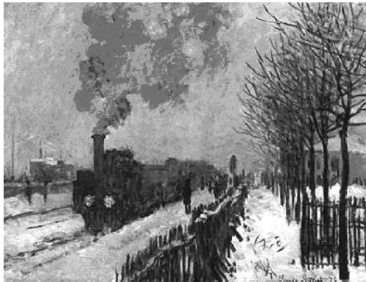
Figura 2: MONET. Le train dans la neige . 1875. (Disponível em: http://www.railart.co.uk/images/monet.jpg . Acesso: 22 maio 2009.)

(KLEITON e KLEDIR. Maria Fumaça . Disponível em: < http://letras.terra.com.br >. Acesso em: 15 set. 2009.)