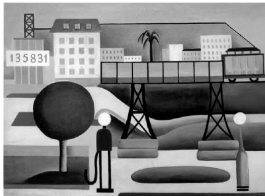
AMARAL, Tarsila do. "São Paulo", 1924. Disponível em: